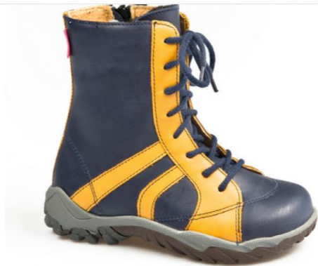
M. 1018 z suwakiem